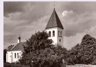
Rungsted Kirke fra 1917 og 1935.