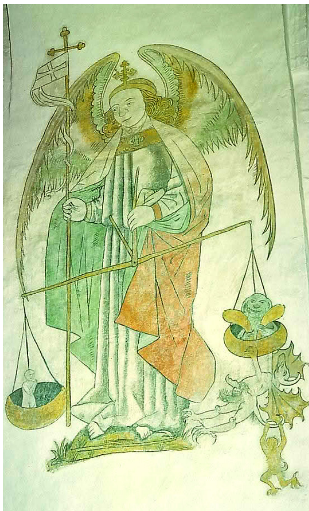
Århus Domkirke.