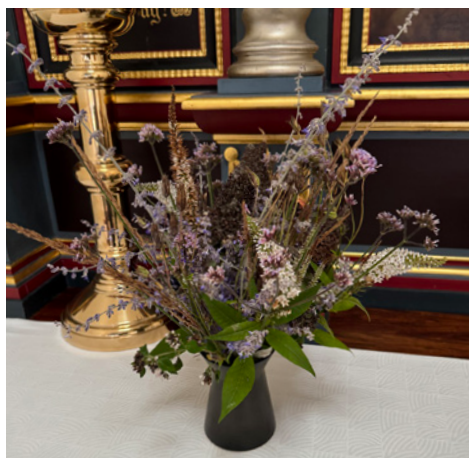
Her er et udvalg af buketterne.