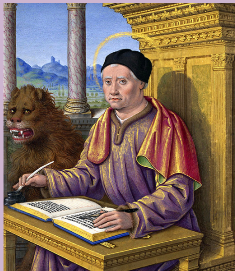
Udsnit af Markus med løve, (1503–1508) Jean Bourdichon