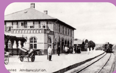
Rungsted Kyst Station, 1909. Toget er på vej ind til perronen