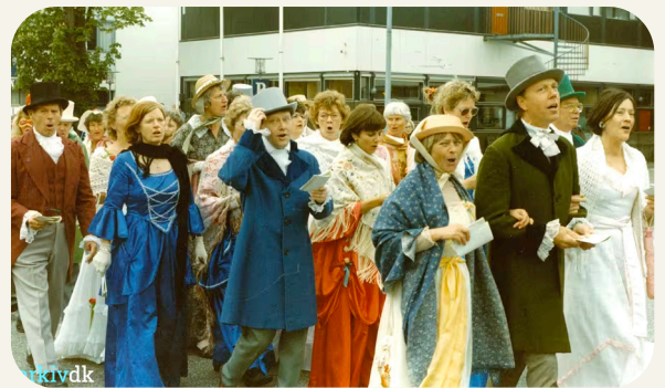
Hørsholm-Koret anno 1989 i jubilæumsparade på Usserød Kongevej.

Mange siger, at de ikke kan synge. Men det kan næsten alle. Stemmen er en muskel, der – ligesom resten af kroppen – bliver stærkere og smidigere med træning. Stemme-fitness! Det handler om at lære at slappe af i krop, kæbe og hals – og trække vejret dybt med hele kroppen. Det giver ekstra ilttilførsel og så giver det udover det gode humør et boost af energi!