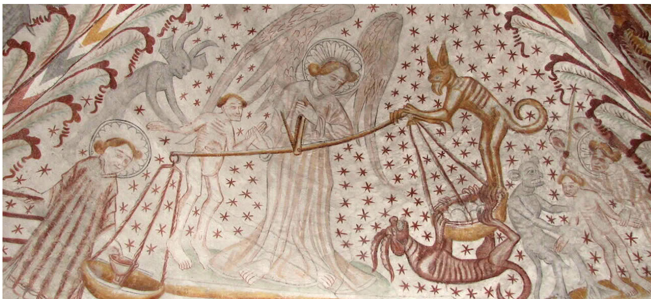
Tybjerg Kirke.

Sankt Mikkel er en fordanskning af Sankt Mikael, ærkeenglen, der ifølge traditionen vejer sjælene på dommens dag og lader vægtens udfald afgøre, om ens sjæl kan få adgang til himlen, eller om man dømmes til at henslæbe sit efterliv i helvede. Derfor er Sankt Mikael ofte afbildet med en vægtskål i hånden.